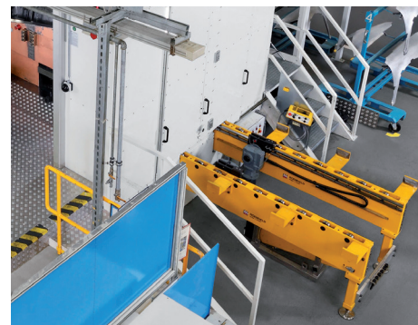
Werkzeug-Wechselkonsole mit Antrieb und seitlicher Beladung der Presse.